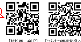
【村松商工会HP】 【むらまつ商売繁盛.com】