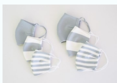
G.F.G.S. original MASK