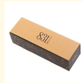
北海道産 乾燥ほぐし まいたけ きくらげ セット