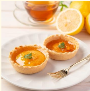
瀬戸内フルーツパイ タルト