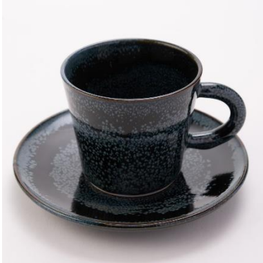
1 商品イメージ画像