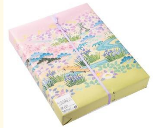
うどん本陣山田家