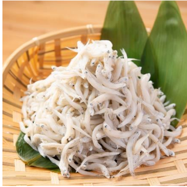
1 商品イメージ画像