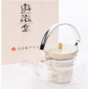
九谷和ガラス 九谷ちろり