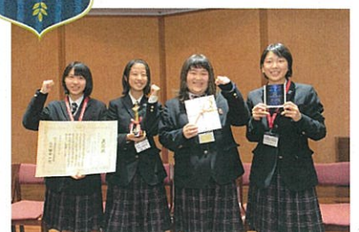
第6回グランプリ受賞 京都府立木津高等学校