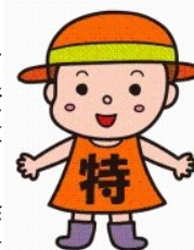
毎月勤労統計調査特別調査 イメージキャラクター「とくちゃん」

この度、「五泉市」が調査対象地区に指定されましたので、下記の流れに基づき、統計調査員が訪問した際には調査にご協力ください。