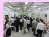
食の大商談会(池袋)

海外見本市でのNICOブース運営、現地情報の収集やアテンドを目的とした海外ビジネスコーディネーターを設置、貿易実務を習得する講座を開催します。