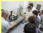
長岡モノづくりアカデミー

『よいモノをつくっているのに伝えべた』という本県企業の課題に対応するため、広報に関する相談会やセミナーを開催します。