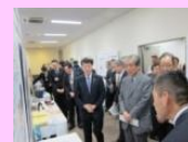
にいがた新技術・新工法展示商談会